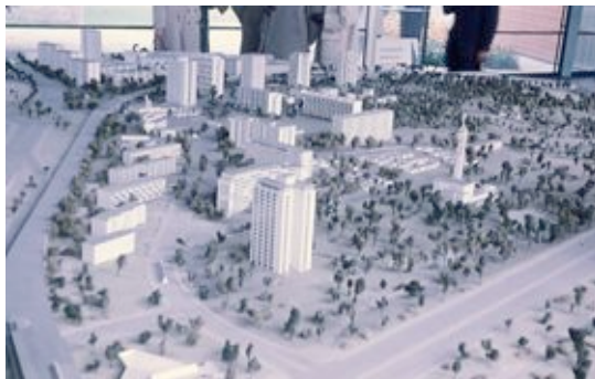
Modell 2 © die stadt von morgen/Hermann Kondermann.jpg