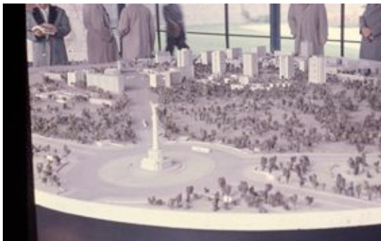
Modell 1 © die stadt von morgen/Hermann Kondermann.jpg