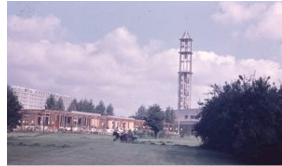
KFG Kirche/Interbau-Restaurant.jpg