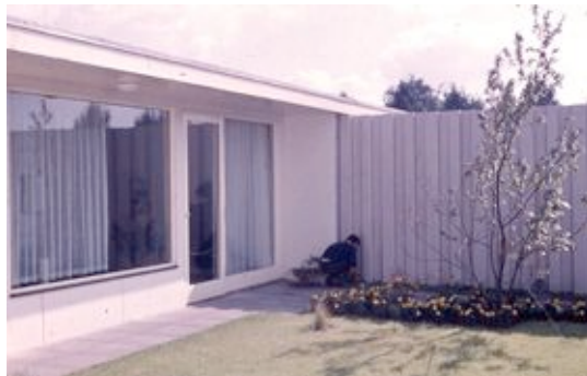
Atriumhof © die stadt von morgen/Hermann Kondermann.jpg