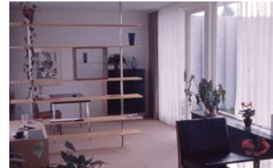
Atriumhaus innen.jpg