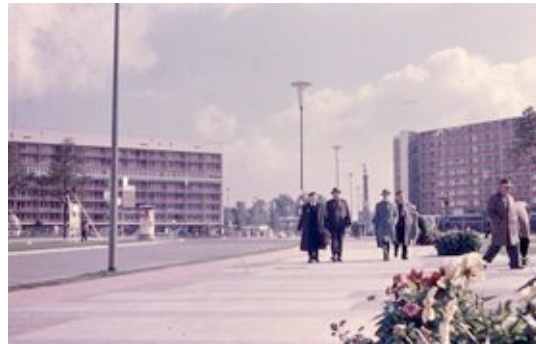
Altonaer Straße © die stadt von morgen/Hermann Kondermann.jpg