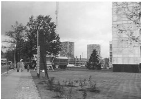
interbau 57_punkthochhäuser kran.jpg