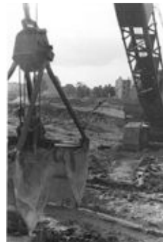
interbau 57_bagger.jpg