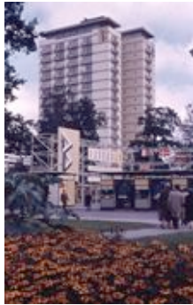
Interbau Eingang © die stadt von morgen/Hermann Kondermann.jpg