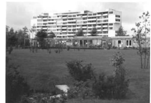
interbau 57_gropius-restaurant.jpg