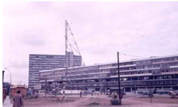
Bikinihaus © die stadt von morgen/Hermann Kondermann.jpg