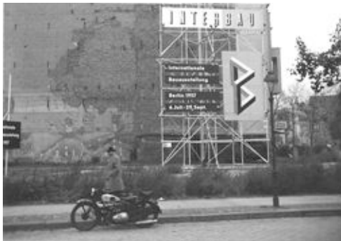
interbau 57_ausstellungsschild.jpg