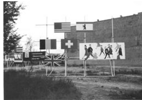
interbau 57_flaggen © die stadt von morgen.jpg