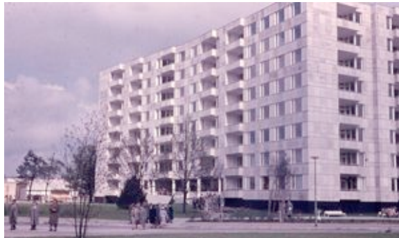
Aalto © die stadt von morgen/Hermann Kondermann.jpg