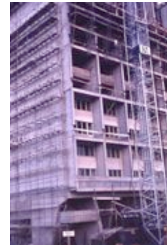
Le Corbusier 2 © die stadt von morgen/Hermann Kondermann.jpg