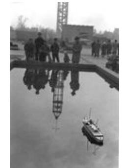
interbau 57_wasserbecken.jpg