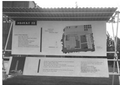
interbau 57_schild obj. 22.jpg