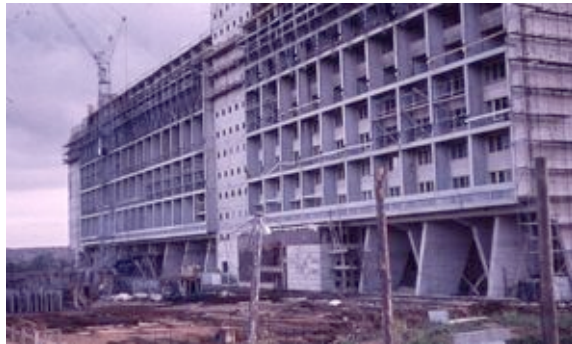
Le Corbusier 1 © die stadt von morgen/Hermann Kondermann.jpg