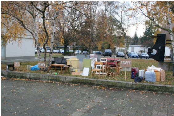
© die stadt von morgen_köbberling-kaltwasser 2 .jpg

Sequenz 1 aus der Arbeit "Hybridraum", 2006 © die stadt von morgen/Folke Köbberling/Martin Kaltwasser, 2006