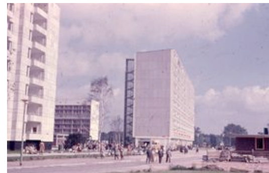
Händelallee 2