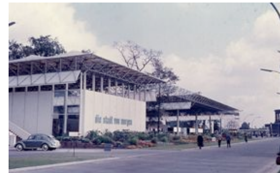
Sonderschau dsvm.jpg