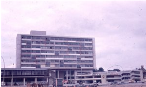
Haus am Zoo.jpg