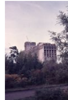
Le Corbusier 3 © die stadt von morgen/Hermann Kondermann.jpg