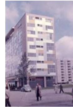
Vago 2 © die stadt von morgen/Hermann Kondermann.jpg