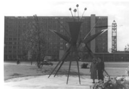
interbau 57_sculptur uhlmann © die stadt von morgen.jpg