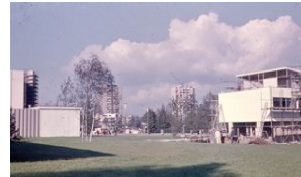
Eternithaus © die stadt von morgen/Hermann Kondermann.jpg