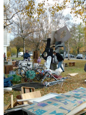
© die stadt von morgen_köbberling-kaltwasser 1 .jpg

aus der Serie "Hansaviertel", C4-Fotografie, 2006 © die stadt von morgen/Annette Kisling, 2006